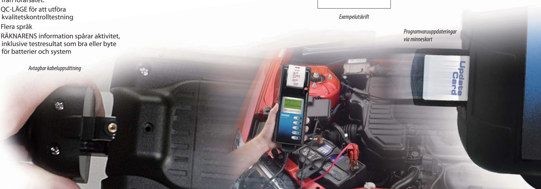
Programvaruuppdateringar via minneskort